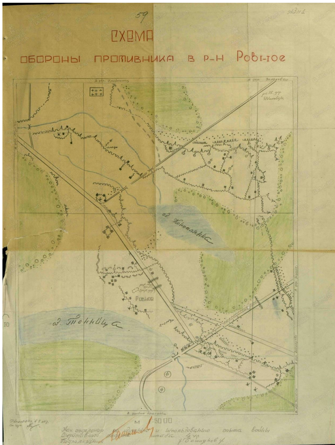
Рисунок 1. — Оборона противника в районе д. Ровное в апреле 1944 г. [9, л. 59]

организации командно-начальствующий состав основной упор делал на обучение частей наступательному бою. Особое внимание уделялось взаимодействию с артиллерией и танками. В каждом полку готовилось по одному штурмовому стрелковому батальону.