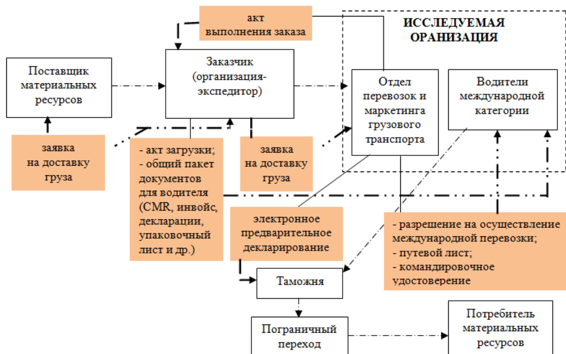
Рисунок 2. – Схема управления международными грузовыми автоперевозками в исследуемой организации: .....▶ движение материального потока; — · · · ▶ сопроводительные документы

Для определения процесса управления международными грузовыми автоперевозками в исследуемой организации, авторами разработана схема данного процесса, представленная на рисунке 2.