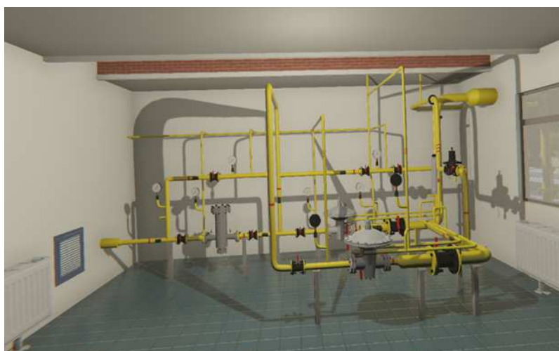
Рисунок 1. – Общий вид виртуального ГРП

Приложение представляет собой точную копию реально существующего ГРП, по которому, надев очки виртуальной реальности, можно походить и выполнить сценарий его пуска и продувки. Общий вид виртуального ГРП представлен на рисунке 1.