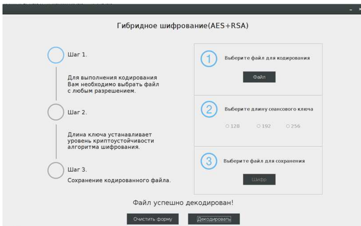
Рисунок 3. – Процесс декодирования данных

Для удобства декодирования в зашифрованный файл передается длина сеансового ключа (рис. 3). Необходимо отметить, что изменение случайного числа до момента дешифрования делает невозможным само дешифрование (рис. 4).