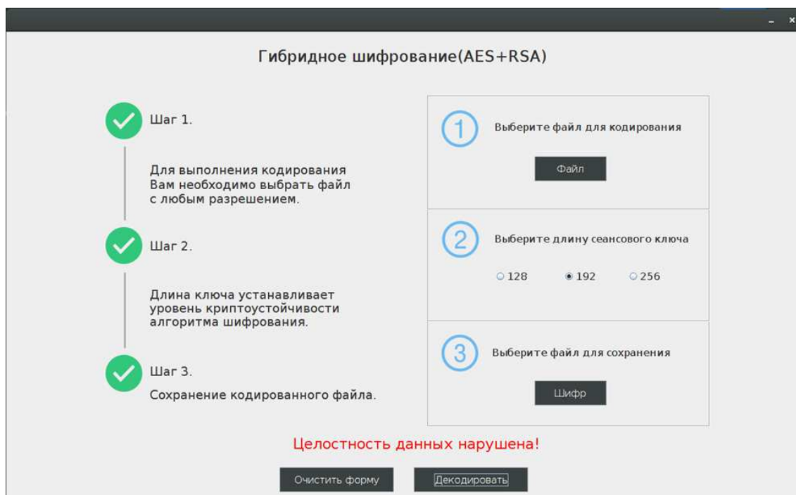
Рисунок 4. – Декодирование измененных данных

Заключение. Рассмотренные технологии Java и Swing, позволяют создать адаптивный интерфейс любого уровня сложности. В ходе данной работы был проведен анализ возможности использования данных технологий для проектирования графического интерфейса пользователя.