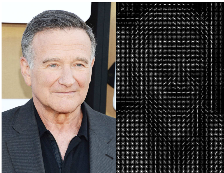
Рисунок 1. – Пример гистограммы направленных градиентов

Основной идеей данного алгоритма является допущение, что внешний вид и форма объекта на фрагменте изображения могут быть описаны распределением градиентов интенсивности. При описании фрагмента изображения оно разбивается на несколько небольших участков, называемых ячейками. В ячейках вычисляются гистограммы направленных градиентов внутренних пикселей. Таким образом, конечный дескриптор, являющийся комбинацией всех гистограмм, отображает направления перехода от света к темноте по всему изображению, показывая упрощенное представление объектов на нем, независимо от его яркости [1]. Пример гистограммы направленных градиентов представлен на рисунке 1.