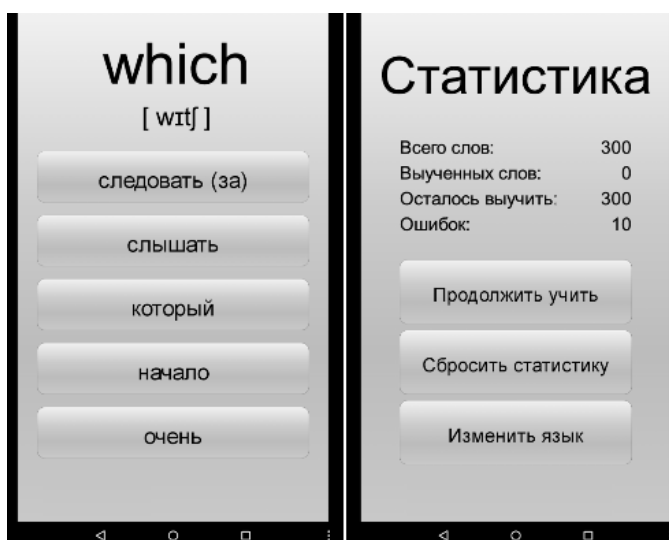
Рисунок 2. – Пользовательский интерфейс приложения «Выучи 90% слов за неделю!»

Вторым примером является приложение «Выучи 90% слов за неделю!», представляющее набор тестов для изучения 300 самых употребляемых английских слов. Также пользователь имеет возможность просмотра статистики. Пример пользовательского интерфейса представлен на рисунке 2.