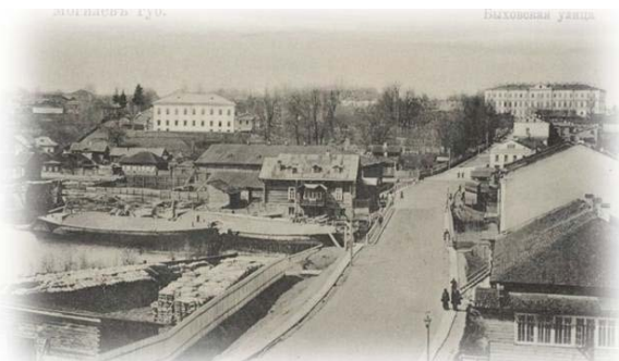
Рисунок 2. – Облик города XX в.

Так же идёт поиск идей для эстетичного построения жилых домов на визуальных осях. (жилой дом на ул. Первомайской). Идёт активное строительство на основных магистралях и в районе промышленных предприятий. В Могилёве наблюдается тенденция присоединения прилегающих деревень городу, свойственная процессам точечной урбанизации. С 1921 года Карабановка, Машековка, Холмы, Броды и Тишовка первая входит в состав Могилёва.