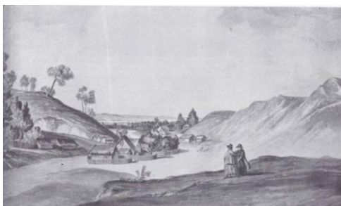
Рисунок 1. – Облик города XVII в.

Жилая архитектура XVII–XIX в. Представление о жилой архитектуре XVII города Могилёва более точное (рис. 1). Некоторые данные о городе даёт описание путешественника Петра Толстого, Бернанда Таннера, академика В. Севергина. Из их слов можно представить город, где было много богатых мещанских домов с украшенными фасадами лепниной и живописью. В задубровенской части города сохранился пример такого дома, его фасад украшен орнаментальной декорацией.