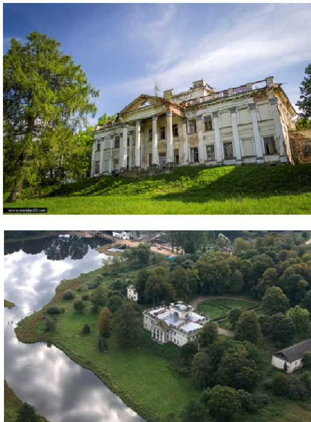
Рис. 3. Современное состояние усадьбы

спасет дворец от разрушения. Но хотелось бы, чтобы новые хозяева не только восстановили историческое здание, но и оставили бы его доступным для посещения. Ведь по красоте дворец в Жемыславле не уступает варшавской королевской резиденции в Лазенках. Пока же здание пустует уже пятый год, и его состояние внушает опасения. Если в ближайшее время не будет начат ремонт, то мы потеряем еще одну страницу своей истории.