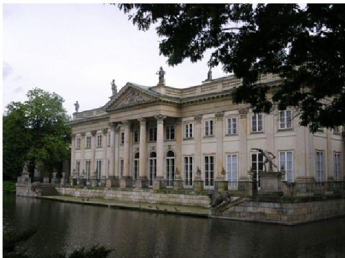
Рис. 1. Дворец на острове. Лазенки, королевская резиденция в Варшаве

Усадьба Умястовских, расположенная в д. Жемыславль Гродненской области не исключение. Она является копией усадебно-паркового комплекса Лазенки в Варшаве (рис. 1). При этом она по своему уникальна. Несмотря на события, которые происходили, усадьба сохранилась до наших дней в хорошем состоянии и мы сейчас можем наблюдать первоклассную отделку стен и множество декоративных элементов.