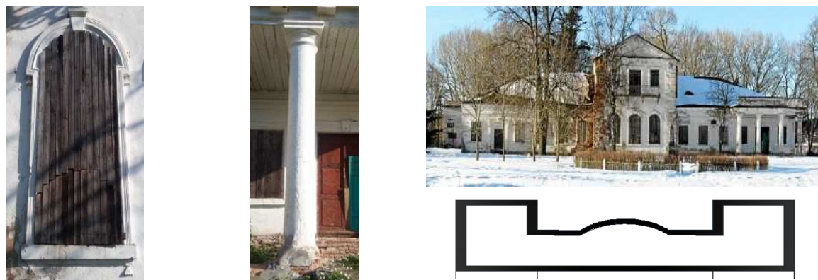
Рис. 2. План и элементы усадьбы

стены снаружи и изнутри пестрят мелкими пилястрами и карнизами. Цветовое решение характеризуется светлыми пастельными тонами. Белый цвет, как правило, служит для выявления архитектурных элементов, являющихся символом активной тектоники (рис. 2).