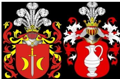
Рис. 1. Герб Гребницких-Докторовичей