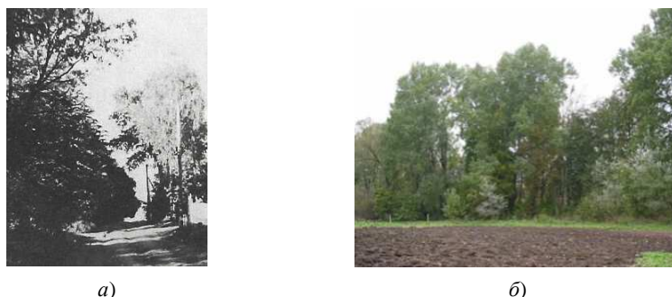
Рис. 3. Парк в конце XX века (а) и в наши дни (б)

Собрание книг, которое находилось в доме, насчитывало около 1200 томов. Библиотека была отделана чёрным дубом. Кроме того, имелась коллекция картин, фарфора, серебра, уникальная коллекция табакерок XVIII – первой половины XIX века. Кроме того, в доме до сих пор сохранилась так называемая тёмная комната, куда обитатели этого дома прятались во время грозы. Перед домом располагался травяной газон, который украшали цветочные клумбы и солнечные часы. Частично сохранился парк, площадь которого составляла 20 га. Парк был спланирован в середине XIX века потомственным архитектором Владиславом Маркони [1]. Аллеи парка украшали стоящие на пьедесталах скульптуры из белого мрамора, привезенные из Италии в конце XVIII – начале XIX века. Скульптуры эти изображали Аполлона, Купидона, Психею, Диану, Геркулеса и других античных героев и богов (рис. 3). По инвентарю 1846 года здесь проживало 585 сельских душ, крестьяне были в основном православными, католиков здесь и сейчас считанные единицы.