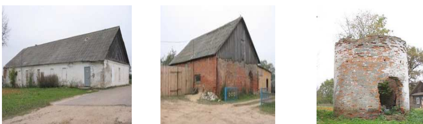
Рис. 5. Хозпостройки

Советская власть пришла сюда сразу после революции, таким образом, все хозяйственно-усадебные постройки автоматически можно датировать дореволюционными. Например, водонапорной башне 100 лет или больше. Учитывая то, какого она качества, можно предполагать, что хозяйство было вполне передовое (рис. 5). В имении была пивоварня, винокурня, кузня.