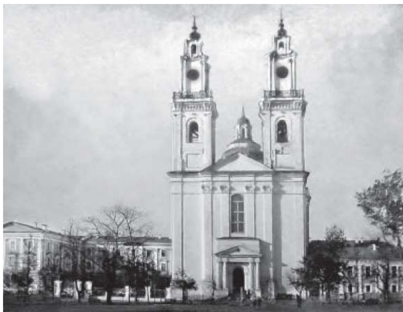
Рис. 1. Свято-Николаевский собор. 1910 г.

В своем окончательном виде храм святого Стефана был освящен 16 августа 1745 года. В 1820 году иезуиты были удалены из Российской империи. Церковь в 1822 году передана монахам ордена пиаров, а после 1830 года – православной церкви.