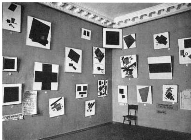
Рис. 1. Футуристическая выставка «Ноль – десять». Малевич К.

На футуристической выставке «Ноль – десять», прошедшей в 1915 году в Петрограде, Малевич выставил 39 своих полотен, в числе которых знаменитый «Черный квадрат», а также «Черный крест», «Красный треугольник» и пр. Помимо этого, были выставлены полотна, выражающие в простых геометрических формах фигуры людей. Малевичем и его учениками была создана группа УНОВИС (Утвердители нового искусства), развивавшая идеи супрематизма.