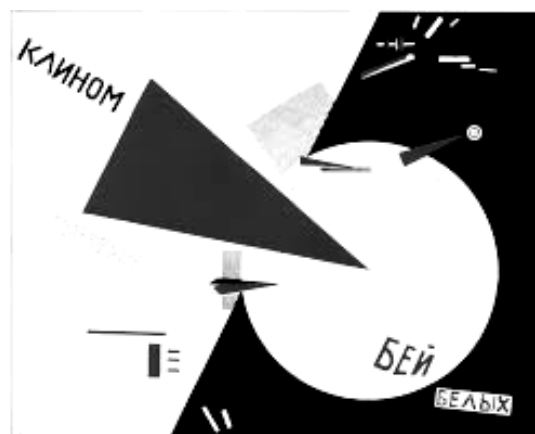
Рис. 5. Плакат 1920 г. Лисицкий Л.М.

В заключение отметим, что супрематизм развивался не только в СССР, но и за пределами этого государства. Примером могут служить беспредметные композиции Мондриана.