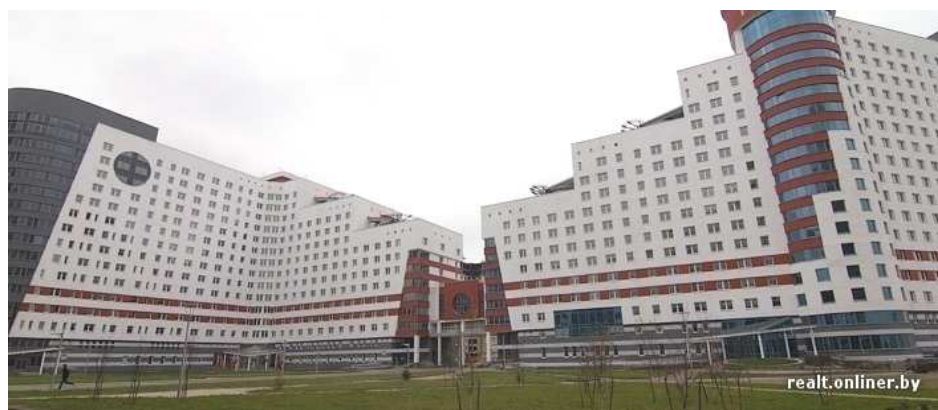
Рис. 3. Общий вид общежития. Минск