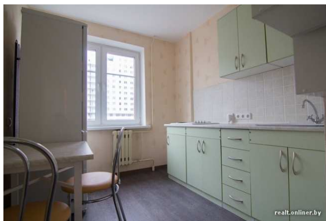
Рис. 5. Интерьер кухни, расположенной внутри блока. Минск

Однако, несмотря на тот факт, что строительство общежитий возобновлено, в целом проблему расселения студентов по нашей стране это не решает.