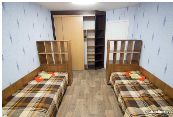
Рис. 4. Интерьер жилой комнаты. Минск