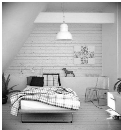
Рис. 5. Яркие пятна в интерьер меланхолика

Цветовое решение мебели и всего интерьера предпочтительнее светлое – разнообразные, нераздражающие оттенки желтого от бледно-желтого и цвета песка до янтарно-желтого и светло-терракотового [5]. Но психологи рекомендуют вносить в эту спокойную атмосферу яркие разрежающие цветовые пятна. Это необходимо для того, чтобы поднять активность меланхоликов и напомнить им о том, что мир вокруг не только спокойный «плюшевый бежевый», но и яркий (рис. 5). В качестве цветовых пятен могут быть шторы, предметы мебели, скатерть на столе, ковер на полу и т.д. [6].