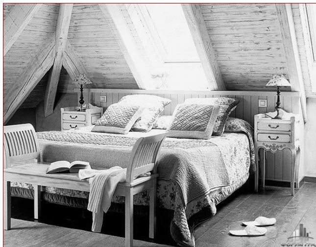
Рис. 2. Уютная зона в интерьере меланхолика.

Создание такого интерьера не означает, что меланхолик нелюдимый и одинокий затворник. Просто такому человеку необходимо иметь место, где он может иногда побыть в одиночестве, наедине со своим внутренним миром, укрыться от окружающего шума и суеты.