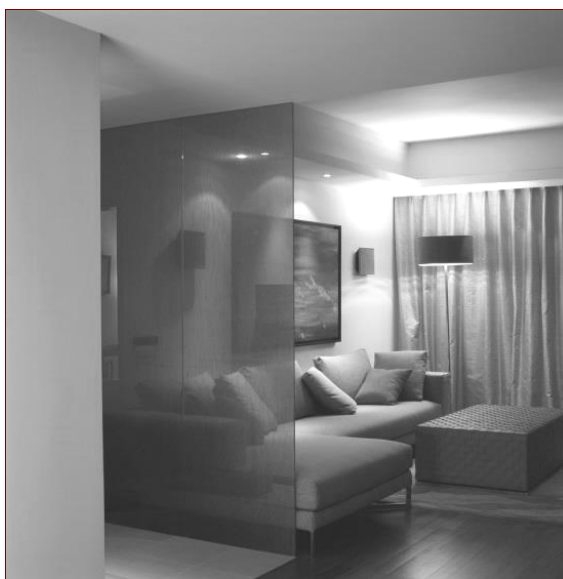
Рис. 3. Использование перегородки в комнате меланхолика

Обычно такие зоны отгорожены стеллажами, ширмами, двигающимися перегородками, корпусными шкафами или просто полупрозрачными жалюзи из ткани (рис. 3).