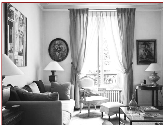
Рис. 1. Тишина и спокойствие в интерьере меланхолика

Именно меланхолик наиболее дотошно и скрупулёзно занимается обустройством собственного жилища. Ведь свой дом он считает настоящей крепостью, убежищем от внешнего мира. Большую часть своего времени меланхолик стремится провести дома, подальше от шумных компаний и посторонних людей. Он любит уединение и тишину (рис. 1). Поэтому каждая деталь, каждый элемент интерьера продуман до мелочей.