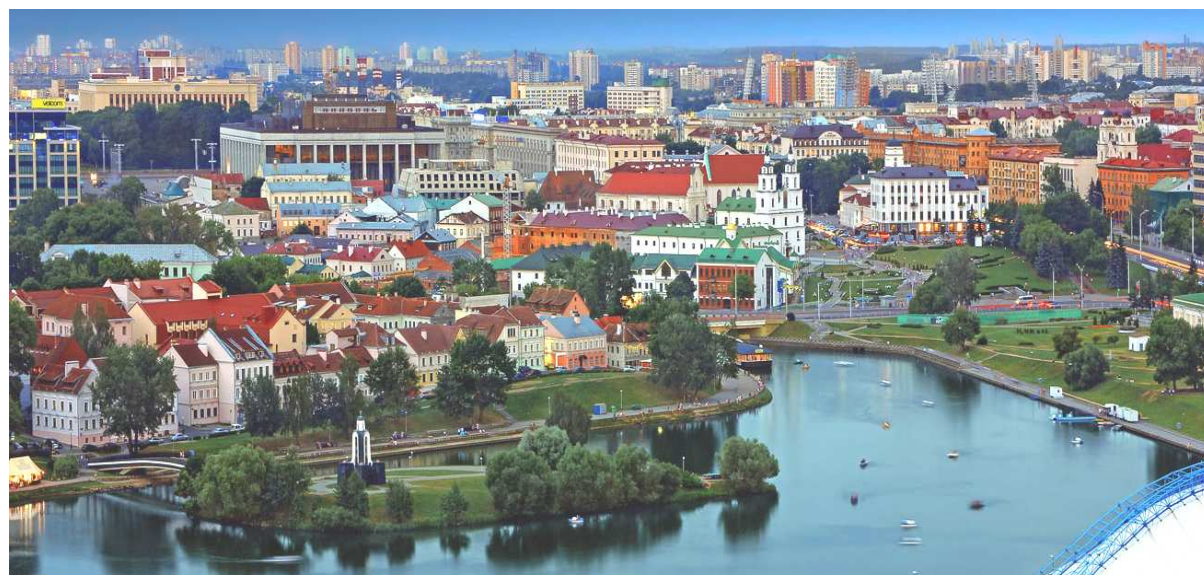
Рис. 4. Панорама исторического центра Минска – Троицкое предместье

Одним из важнейших средств достижения индивидуальности внешнего вида центра является регенерация исторической застройки. Регенерация, реконструкция и многие другие мероприятия необходимо проводить для поддержания и восстановления исторических центров городов, так как они являются не только историко-культурным наследием для любой страны, но и позволяют формировать туристические центры (рис. 4).