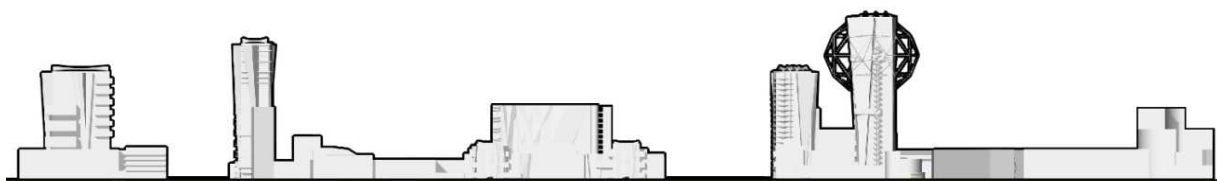
Рис. 3. Развертка застройки по улице Молодежной (проектное предложение)

Соразмерность – соотношенность пропорций и масштаба пространственных элементов с человеком и с основными характеристиками города.