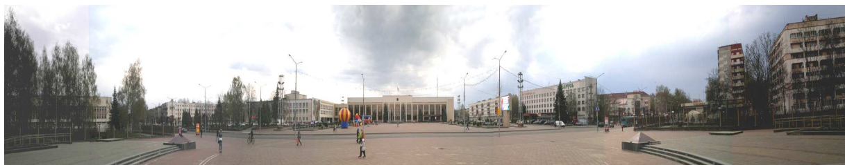
Рис. 2. Панорама общегородского центра Новополюцка, ул. Молодежная (существующее положение)