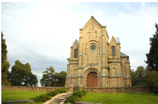
Мал. 2. Касцёл Узнясення Святога Крыжа, Астравец

Касцёл Узнясення Святога Крыжа ў г. Астравец (мал. 2) пабудаваны ў 1910–1911 гадах на каталіцкім цвінтары (вул. Ленінская, 7). Урачыста ўзняты на пагорак і высокі цокаль, выкладзены магутнымі вапняковымі квадрамі. Ля касцёла быў пахаваны першы рускі консул у Японіі І.А. Гашкевіч (1814–1872; магіла не захавалася) [4].