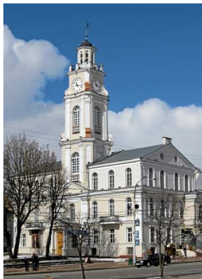
Рис. 1. Ратуша сегодня

Строить ратушу могли только жители городов, получивших магдебургское право – право на самоуправление. 17 марта 1597 года польский король и великий князь Литовский Сигизмунд III Ваза даровал его Витебску, который в этот период входил в сосав литовского княжества. Именно с этой датой и связано начало строительства Витебской ратуши (рис. 1). Вскоре на городской площади появилась деревянная постройка, которая находилась неподалеку от Взгорского замка.