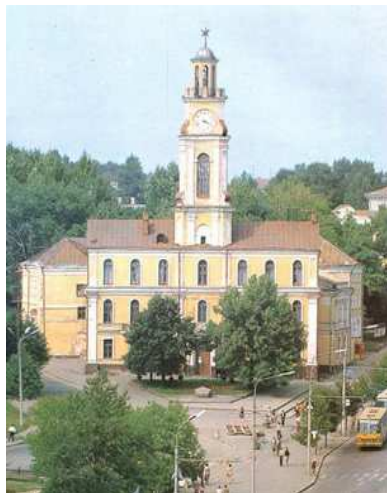
Рис. 3. Ратуша, 1985 год

Как свидетельствует история города, это было лишь начало преобразования главной достопримечательности архитектуры Витебска. В 1911 году наметилась очередная реконструкция. В результате преобразился внешний вид: достроенный третий этаж кардинально изменил и нарушил первоначальные идеальные пропорции Ратуши. Исчезли легкость и грациозность. Порттик, пристроенный к главному входу, и полуциркульные окна второго этажа придали Ратуше больше массивности, а внешний вид здания создавал грозное ощущение непоколебимости и устойчивости.