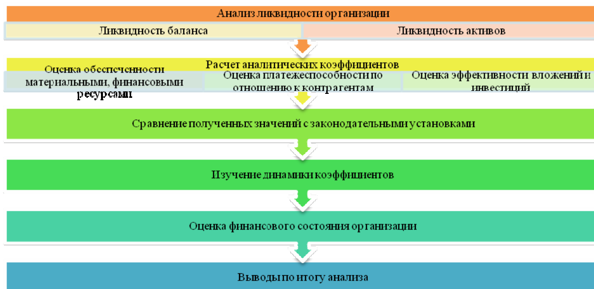
Рис. 3. Этапы анализа финансовой независимости

В современной практике не существует единого подхода к анализу финансовой независимости коммерческих организаций. Проанализировав зарубежную и отечественную литературу, автор предлагает проводить анализ финансовой независимости следующим образом: