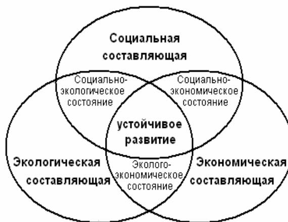
Рис. 1. Сущность концепции устойчивого развития

Экологическая составляющая требует отказа от загрязнения экосистемы в процессе жизнедеятельности человека, т.е. внедрение экологических и ресурсосберегающих технологий во всех сферах производства, а также дальнейшее рациональное и грамотное потребление произведенных товаров и услуг с последующей утилизацией или переработкой отходов.