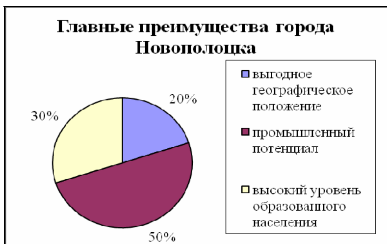
Рис. 3. Главные преимущества города Новополоцка

Далее мы рассмотрели вопрос о конкурентных преимуществах города. Результаты представлены на рисунке 3.