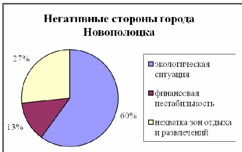
Рис. 2. Негативные, по мнению жителей, черты города Новополоцка

Самой главной проблемой города большинство опрошенных, что вполне закономерно, посчитало экологическую ситуацию. В эту группу входит загрязнение воздуха вследствие выбросов промышленными организациями вредных веществ, а также загрязнение воды и почвы.