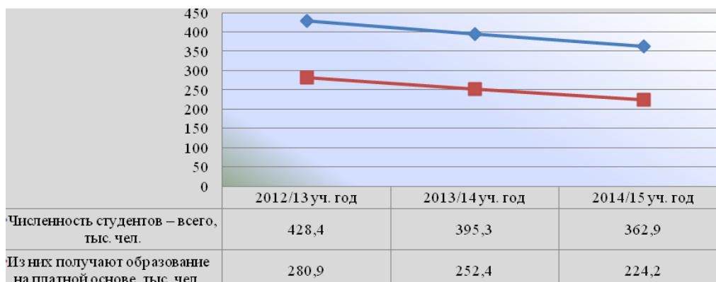
Рис. 1. Динамика численности студентов высших учебных заведений за 2012/13 – 2014/15 уч. гг.

Для начала рассмотрим количество студентов, обучающихся на платной основе, т.е. деятельность университета, приносящую основные внебюджетные средства (рис. 1).