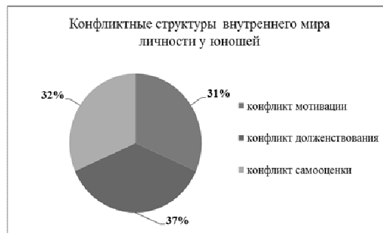
Рисунок 4. – Конфликтные структуры внутреннего мира личности у юношей

Можно объяснить полученные результаты через гендерные стереотипы о предназначении мужчин и женщин в обществе. Чаще всего сущность женщины характеризовалась следующими особенностями: женщина неполноценное и, в сущности, зависимое существо; женщина ниже по сравнению с мужчиной существо, так как ей присущи крайняя ограниченность и слабость; по своей внутренней сущности она не представляет собой ценности. Мужчина же считается «кормильцем», который осуществляет общее руководство и несет главную ответственность за происходящее. Предположительно по причине данных гендерных стереотипов, у девушек чаще возникает конфликт самооценки, у юношей – конфликт долженствования.