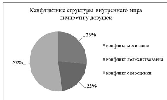
Рисунок 3. – Конфликтные структуры внутреннего мира личности у девушек