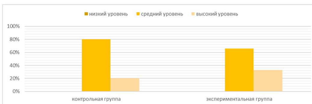
Рисунок 5. – Сравнительный анализ контрольной и экспериментальной групп в зависимости от степени выраженности уверенности в себе

Затем нами были проанализированы различия контрольной и экспериментальной групп по степени уверенности в себе. Сравнительный анализ выборок представлен на рисунке 5.