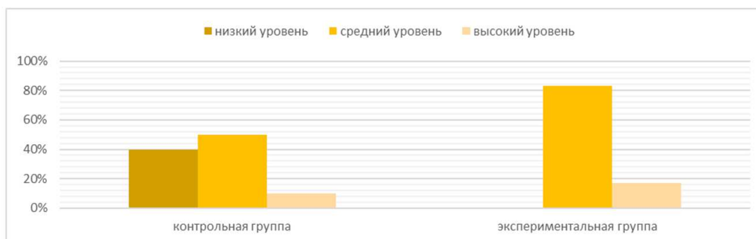
Рисунок 3. – Сравнительный анализ контрольной и экспериментальной групп в зависимости от степени выраженности лидерских способностей

Затем нами были проанализированы различия контрольной и экспериментальной групп по степени выраженности у респондентов лидерских способностей. Результаты представлены на рисунке 3.