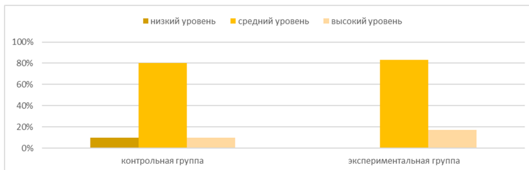
Рисунок 2. – Сравнительный анализ контрольной и экспериментальной групп в зависимости от степени выраженности силы воли

Далее нами были проанализированы различия контрольной и экспериментальной групп в степени выраженности у респондентов силы воли после проведения тренинговой программы.