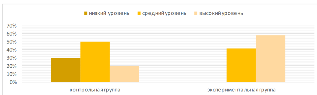
Рисунок 1. – Сравнительный анализ контрольной и экспериментальной групп в зависимости от степени выраженности инициативности

Были проанализированы различия контрольной и экспериментальной групп по степени выраженности у респондентов инициативности после проведения тренинга. Результаты представлены на рисунке 1.