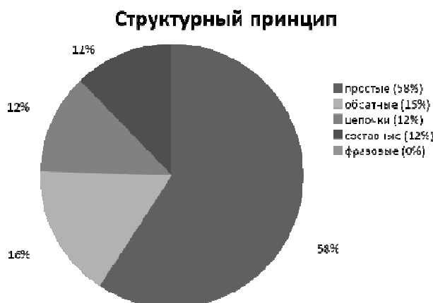
Рисунок 2. – Структурный принцип классификации эпитетов по Гальперину

Подводя итог всему вышесказанному, можно сделать следующие выводы. Несмотря на то, что эпитет как стилистический прием, более характерен для художественной литературы, где данный троп, несомненно, чаще употребляется в своей экспрессивной функции, в газетном стиле мы также встречаем эпитеты. Однако здесь преобладающей функцией является характеризующая, фокусирующая внимание читателя на определенных деталях, что помогает выделить главное, привлечь внимание к наиболее важным аспектам, выдвигая их на первый план при помощи эпитетов, придающих речи особую выразительность. Реже всего встречается оценочная функция, т.к. целью автора не является показать личностное отношение к объекту обсуждения, а лишь привлечь внимание к проблеме и вызвать ответную реакцию. Достижению данной цели способствует и употребление многочисленных ассоциированных эпитетов.