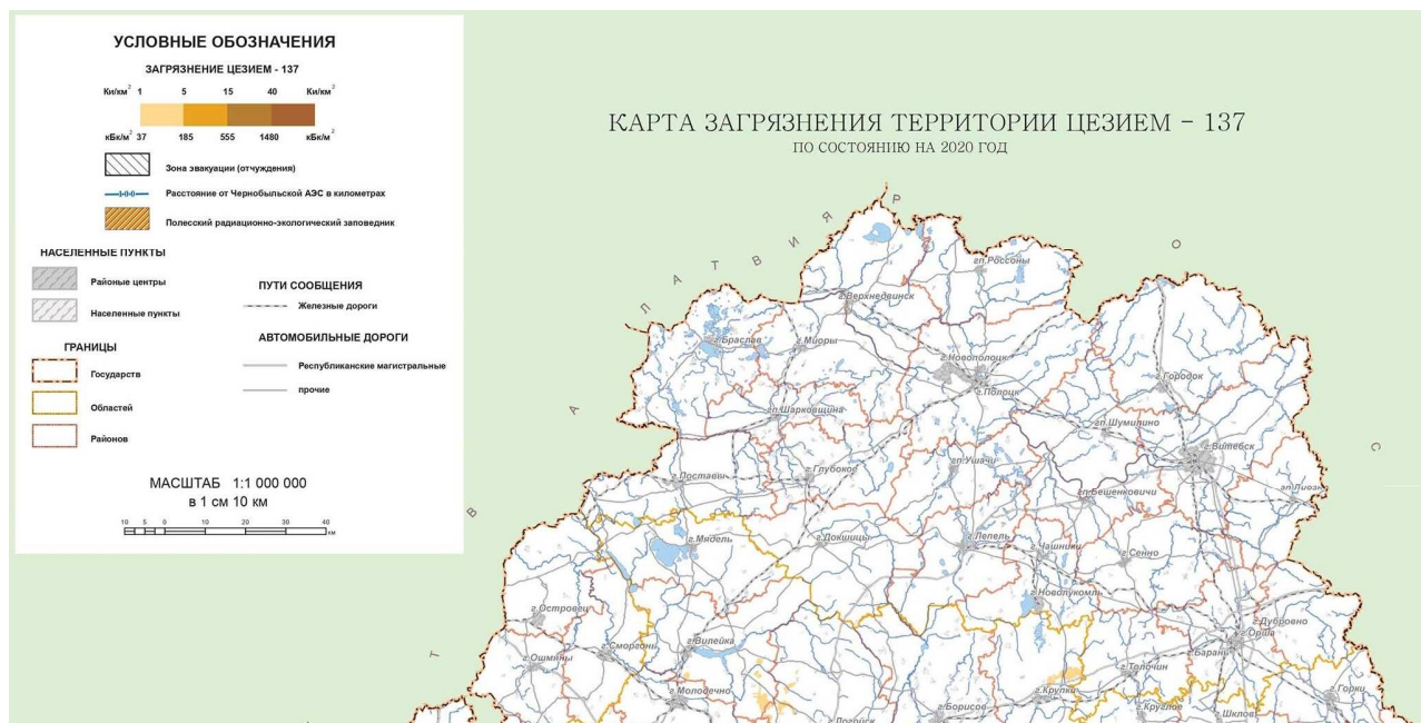
Рисунок 2. – Карта загрязнения Витебской области цезием-137

Заключение. Конечно, сделанный вывод касается только цезия-137, мониторинг которого и проводится на вышеупомянутом сайте. Совершенно другая ситуация с радон-222, концентрация которого на территории Беларуси сосредоточена как раз в Витебской области. Однако, это тема для будущих статей.