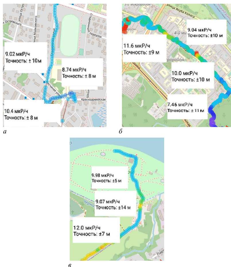
а – г. Браслав; б – г. Новополоцк; в – г. Полоцк

С помощью мобильного приложения RadiaCode, созданного специально для работы с дозиметром Radiacode-101, в ходе передвижения по городу производился постоянный мониторинг уровня радиационного фона с построением GPS-трека измерений с привязкой к местности. Каждые 10-15 с создавался пометка на встроеной карте с данными о количестве мкР/ч, температуре и времени появления метки (рис. 1).