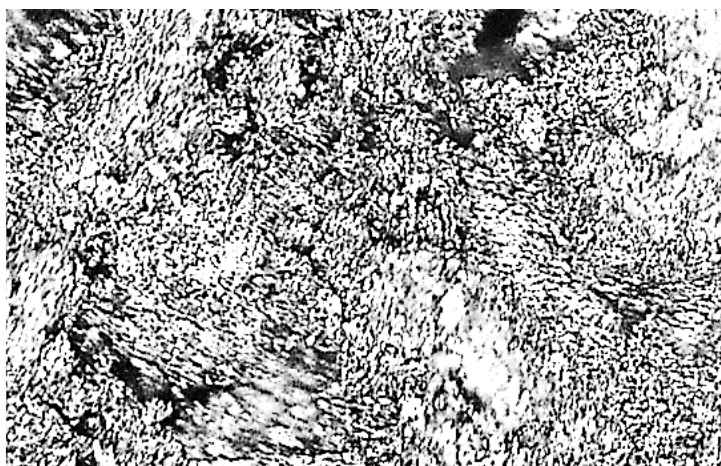
Рисунок 2. – Микроструктура нефтяного кокса

Микроструктура образцов кокса, согласно ГОСТ 26132-84, оценивается, примерно, 3-4 баллами, что соответствует мелко- и средневолокнистой структуре соответственно с размером волокон от 10 до 30 мкм (рисунок 2).