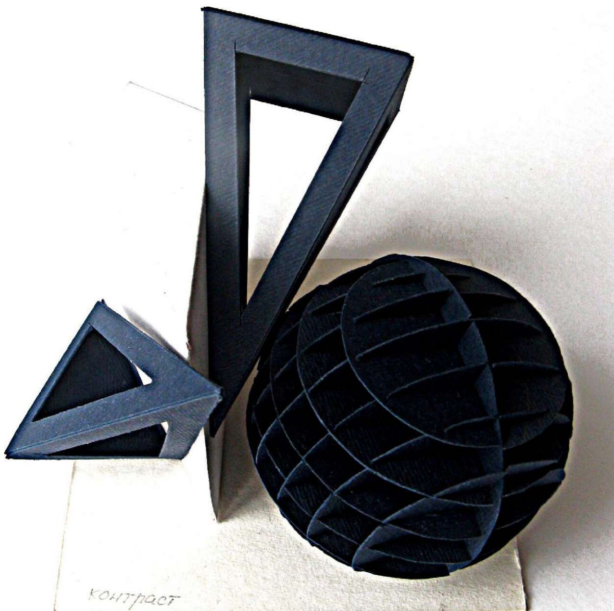
Рис. 9 Студенческая работа на тему «Контраст»

Контраст должен быть умеренным, поскольку чрезмерно резкие контрасты будут способствовать преждевременному утомлению, а полное отсутствие контраста - создавать монотонность, обуславливать притупление внимания.