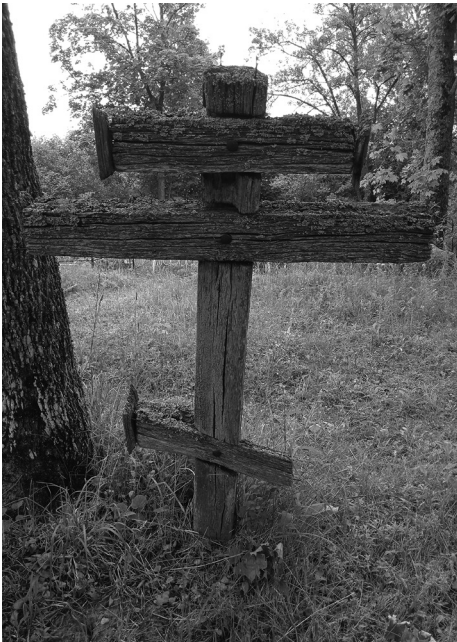
Драўляны крыж на могілках в. Ніўнікі Мёрскага р-на. 2021 г.

чаюць даследчыкі XIX – пачатку XX ст., шлюбны паміж стараверамі і мясцовым насельніцтвам амаль не заключаліся: «Ад акружаючага іх насельніцтва яны [стараверы. – У. А.] трымацца асобна, не роднячыся з імі шляхам шлюб» [Вітэбская губернія 1890, 284–285]. Але ўсё ж такія выпадкі мелі месца: «Асабліва шкодных праяў расколу ў справаздачным годзе [1896. – У. А.] не было толькі з прычыны пазাপраўнага супражывання раскольнікаў з праваслаўнымі (шлюбны па раскольніцкіх абрадах) было 12 выпадкаў адпазнення праваслаўных у раскол, але ва ўсіх гэтых выпадках прыняты належныя меры да звароту адпаўшых ва ўлонне праваслаўнай царквы» [ОВГ 1896, 48]. У пераважнай большасці гэта адносіцца да жаночай паловы стараверскага насельніцтва: «Яшчэ маладзіцы-стараабрадкі іншы раз выходзяць замуж за беларусаў і латышоў, мужчыны ж ніколі не бяруць сабе жонак з іншых народнасцяў» [Вітэбская губернія 1890, 284–285]. Але часам і мужчыны-стараверы бралі сабе ў жонкі мясцовых дзяўчат: