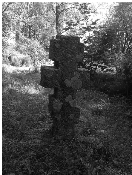
Каменны крыж на могілках в. Кірыліна Браслаўскага р-на. 2021 г.

Акрамя гэтых назваў, мясцовае беларускае насельніцтва мела некаторыя найменні старавераў, якія датычыліся спецыфікі іх заняткаў ці нейкіх культурных адметнасцей. Як вынікае з крыніц, называлі старавераў і «бурлакамі»: «...акрамя пошукаў адасобленага жыцця і вольнай раллі, рускія людзі з “непомных”, як гавораць стараверы, часоў хадзілі на Літву – дзеля заробкаў, пераважна па раздзелцы і сплаве па Нёмане лесу, адгэтуль мясцовае найменне іх бурлакамі, якое захавалася да нашых дзён [на пачатак XX ст. – У. А.] і ўжываецца да ўсіх старавераў і наогул выхадцаў з карэннай Расіі» [Станкевіч 1909, 8]. Падобная назва старавераў яшчэ фіксавалася ў ходзе палявых даследаванняў