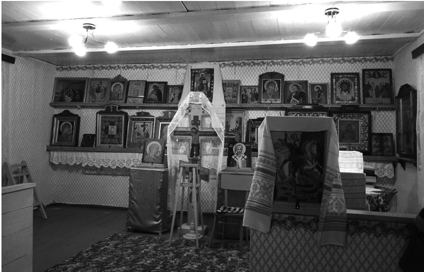
Інтэр'ер стараверскай малельні ў аг. Друя Браслаўскага р-на. 2021 г.

Стараверы Падзвіння таксама мелі некалькі найменняў у адносінах да мясцовага беларускага насельніцтва. Стараверы Шуміліншчыны называлі нестаравераў злябамі : Злябы месных называлі, ня любілі нас 2 . Часам яны выкарыстоўвалі словы паганікі (па прычыне рэлігійнай адрознасці: «Паганікі – прадаліся» 3 ), сінакі (зневажальнае слова, якім стараверы называлі праваслаўных [Отчет 1889, 203]) і г. д. Як вынікае з аналізу матэрыялаў, большая частка гэтых