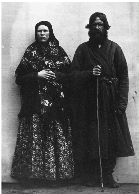
Сяляне-стараверы Лепельскага павета. 1866 г.

Сярод мясцовага беларускага насельніцтва істотная ўвага была засяроджана на адметнасцях у адзенні. Нягледзячы на тое, што касцюм старавераў ужо з канца XIX ст. зазнаў істотныя змены, на што звярталі ўвагу даследчыкі, але некаторыя дэталі традыцыйнага строю дажылі і да нашых