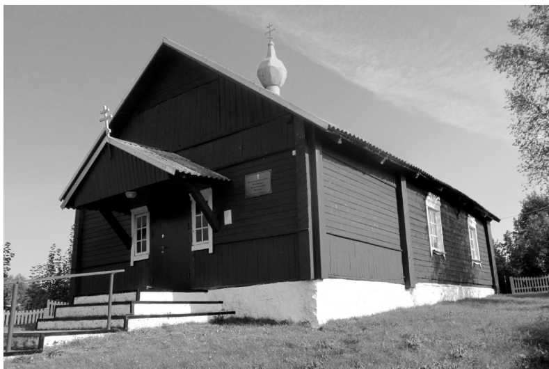
Багаяўленская стараверская царква ў в. Ластавічы Глыбоцкага р-на. 2021 г.

старавераў з Асташкаўскага павета Цвярской губерні), быў Я. Баршчэўскі: «А каб мець большы прыбытак з азёраў, наводзяць [паны. – У. А.] штогод зімою асташоў, кажуць, што гэтыя рыбакі нібыта пасылаюць пад лёд злога духа, і той заганяе рыбу ў нерат; дык яны спустошылі ў нас усе азёры, навучылі нашу моладзь бязбожным учынкам, чарам, бессаромным песням» [Баршчэўскі 1998, 146]. Падобным чынам пісаў пра «асташоў» і вядомы этнограф С. В. Максімаў: