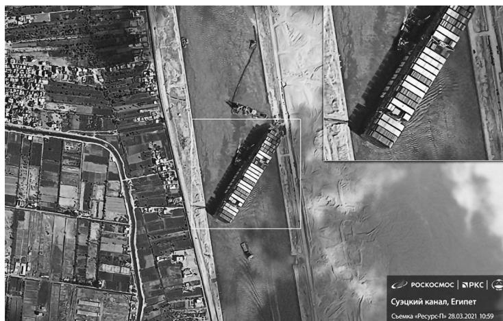
Рис. 1. Съемка Суэцкого канала спутником 23 марта 2021 г.

По информации на 26 марта, в очереди на прохождение через канал собралось более 150 других судов (к 27 марта – 276 судов, к 28 марта – 321 судно, к 29 марта – свыше 450 различных судов).