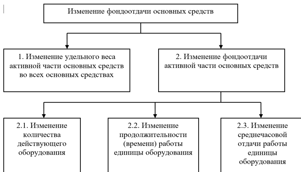
Рисунок 1 – Двухуровневая структурно-логическая модель факторной системы фондоотдачи основных средств

Одним из этапов обязательно рассматривается факторный анализ объекта с указанием структурно-логических схем и факторных систем. Пример структурно-логической модели представлен на рисунке 1.