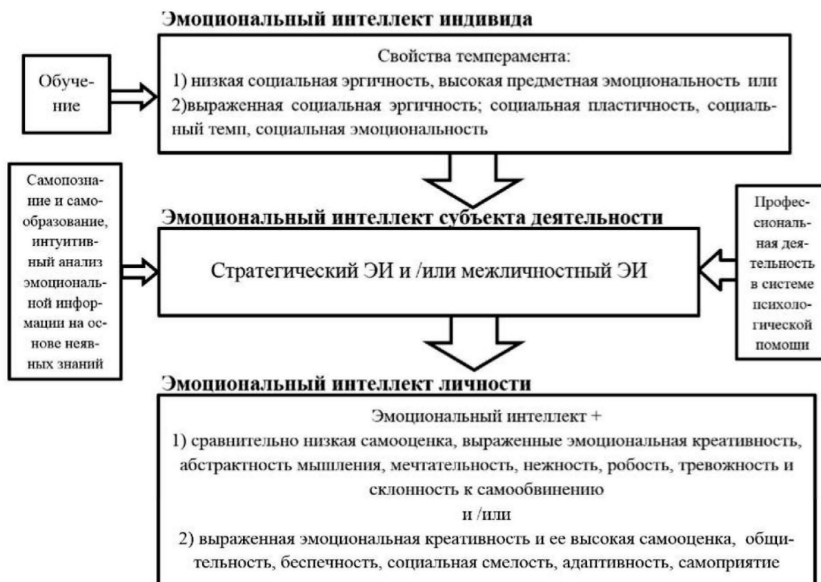
Рисунок 2 — Структура эмоционального интеллекта психолога

Таким образом, интегративная модель структуры эмоционального интеллекта в основном нашла своё эмпирическое подтверждение. Эмпирическая модель так же, как и теоретическая интегративная модель структуры ЭИ, имеет трёхуровневое строение и включает: на первом уровне — параметры темперамента; на втором уровне — параметры инструментального и индивидуально-личностного эмоционального интеллекта; на третьем уровне — личностные факторы.