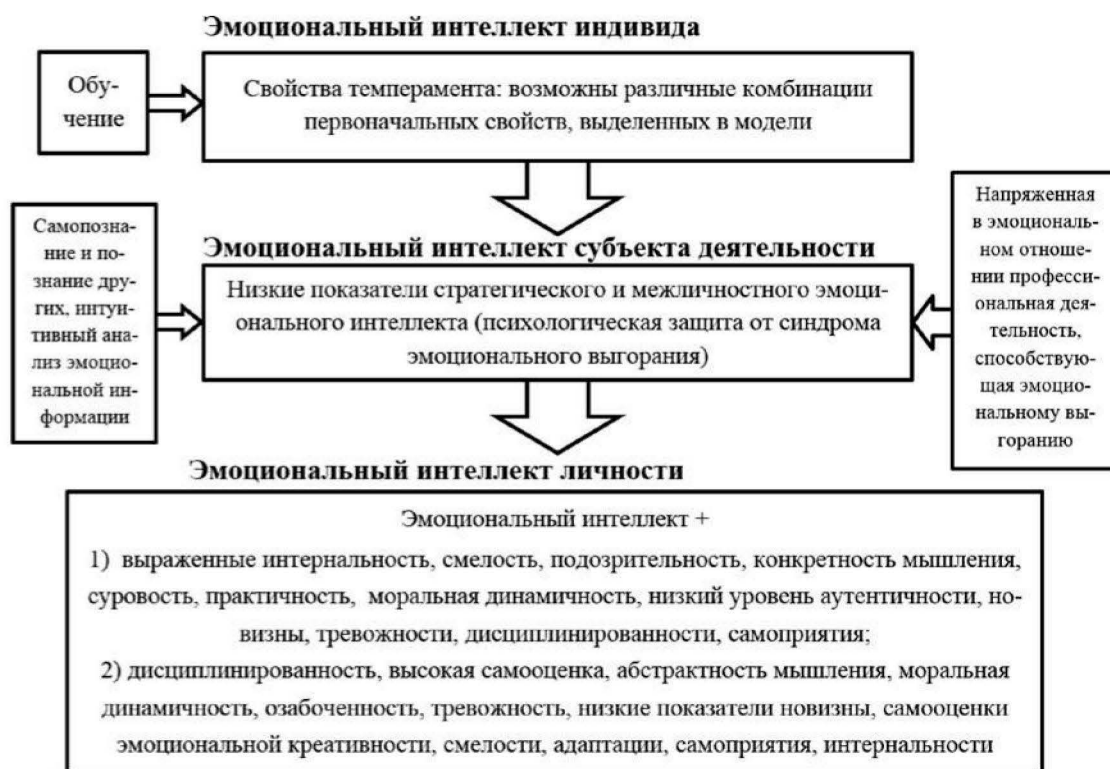
Рисунок 3 — Структура эмоционального интеллекта педагога