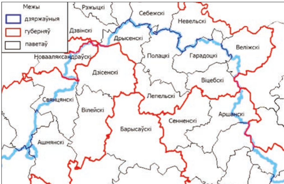
Мал. 1. Адміністрацыйна-тэрытарыяльны падзел у паўночнай частцы Беларусі і сумежных тэрыторый у другой палове XIX — пачатку XX ст.

склад у сярэдзіне XIX — пачатку XX ст. Геаграфічныя межы даследавання ахопліваюць тэрыторыю Полацкага паведа Віцебскай губерні (мал. 1). Аднак для выяўлення асаблівасцей працякання дэмаграфічных працэсаў у працы нярэдка супастаўляюцца даныя з іншымі беларускімі паведамі Віцебскай губерні. Крыніцазнаўчай базай даследавання стаў комплекс статыстычных і дэмаграфічных матэрыялаў па стараверскаму насельніцтву рэгіёна ў другой палове XIX — пачатку XX ст. Менавіта гэты перыяд характарызуецца наяўнасцю дастатковай колькасці даных, якія дазваляюць дасягнуць пастаўленай мэты.