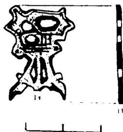
Рис. 1. Подвеска из частной коллекции Сергея Михейки, найдена на берегах Двины в районе Заполотья