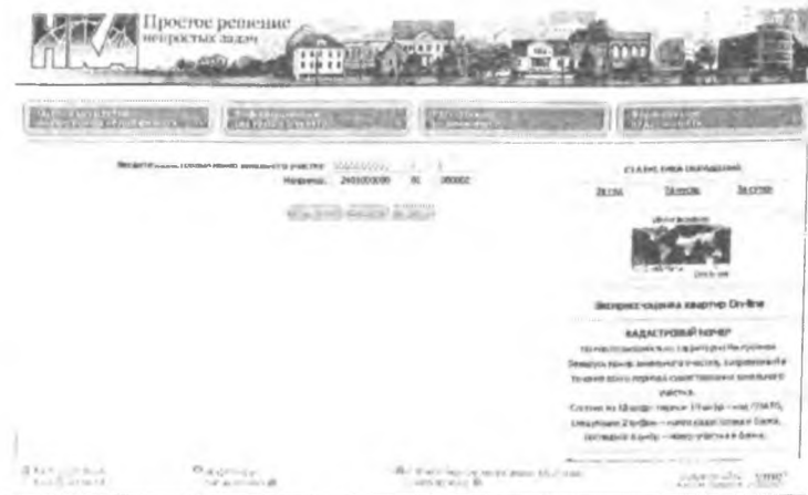
Рис. 2. Введение кадастрового номера

Как пример рассмотрим поиск по кадастровому номеру (рис. 2, 3):