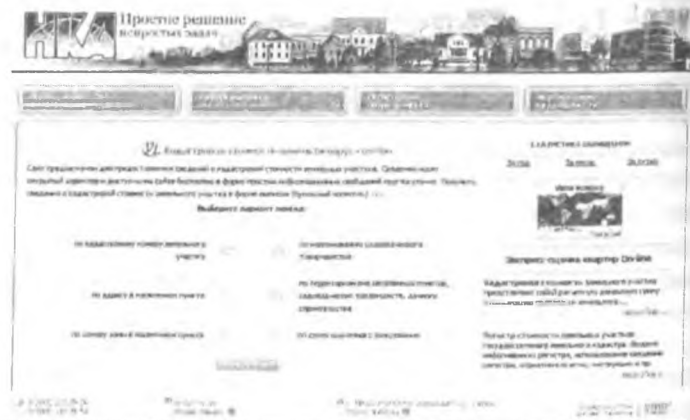
Рис. 1. Главная страница Интернет-ресурса

Как пример рассмотрим поиск по кадастровому номеру (рис. 2, 3):