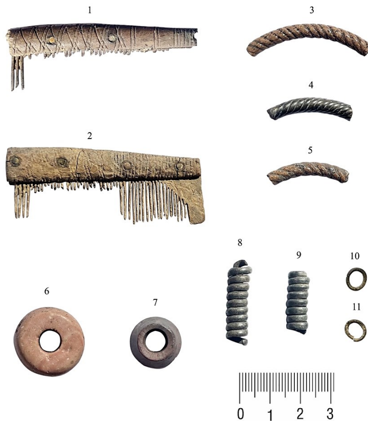
1–2 – грабяні; 3–5 – шклянныя бранзалеты; 6–7 – прасліцы; 8–11 – дэталі галаўнога венчыка