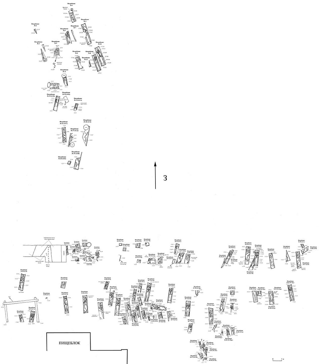
Малюнак 2. – Сітуацыйны план размяшчэння даследаваных пахаванняў могільніка XI–XIII стст. на тэрыторыі Верхняга замка Полацка

Падчас даследавання ў пахаваннях зафіксаваны адзінкавыя знаходкі (малюнак 3). Сярод выяўленых артэ-фактаў неабходна адзначыць фрагменты шкляных бранзалетаў (пахаванні №№ 2, 9, 15, 42, 47, 56, 72), прасліцы (пахаванні №№ 15, 22, 35, 69, 96), ілжэвіты пярсцёнак з каляровага металу (пахаванне № 1), паясныя кольцы і спражкі (пахаванні №№ 13, 71, 87), шклянныя пацеркі (пахаванне № 84), цвікі (пахаванні №№ 2, 10), рэшткі спархнелага алавянага галаўнога венчыка (пахаванне № 43), фрагменты амфар (пахаванні №№ 34, 35), а таксама шматлікія фрагменты керамічных гаршчкоў “S”-падобнага профілю, тыповыя для культурнага слою Полацка XII–XIII стст. Асобна неабходна вылучыць знаходкі двух фрагментаў аднабаковых грабянёў (пахаванні №№ 57 і 58; малюнок 3:1, 3:2) і цалкам захаваны галаўны венчык, складзены са спіралек і колцаў (пахаванне № 71, ма-люнкі 3:8–3:11).