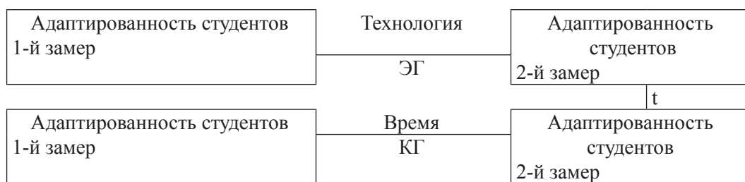
Рис. 3. Схема исследования адаптированности

Пояснение: линии между блоками означают необходимость выявления различий выраженности склонности быть лидером и уровня адаптированности до и после внедрения технологии оптимизации этой склонности.