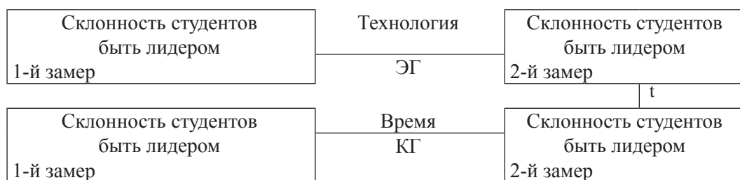
Рис. 2. Схема исследования склонности быть лидером

Решение 5-й задачи предполагает обучение и тренинг студентов педагогических специальностей по развитию склонности быть лидером, а также саморазвитие наиболее эффективных и оптимальных для лидерства психологических свойств личности, внедрение полученных умений и знаний в практику.