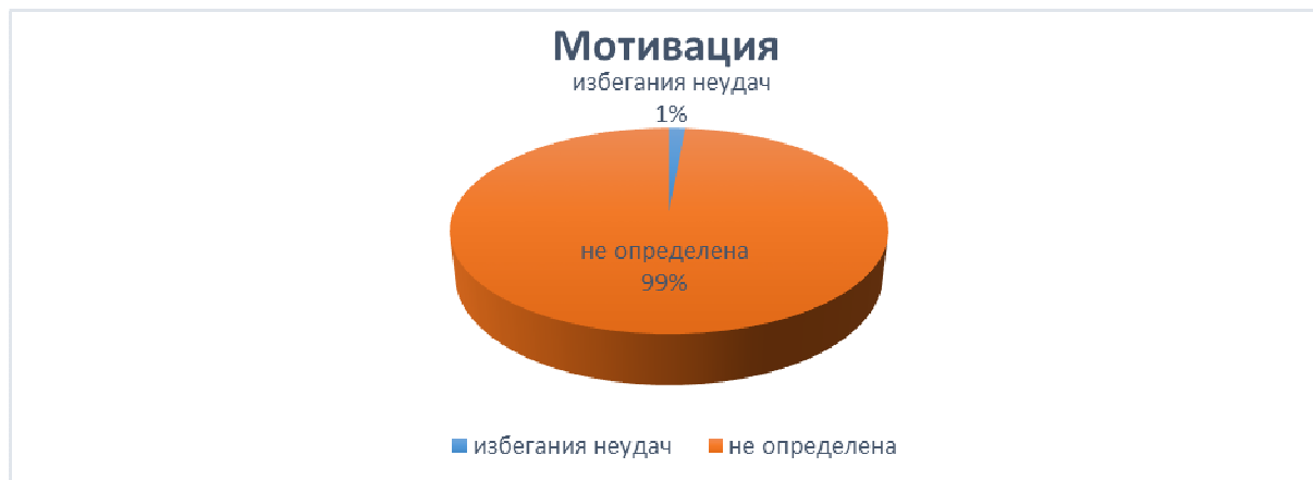
Рисунок 2. – Процентное соотношение выраженности мотивации у личности