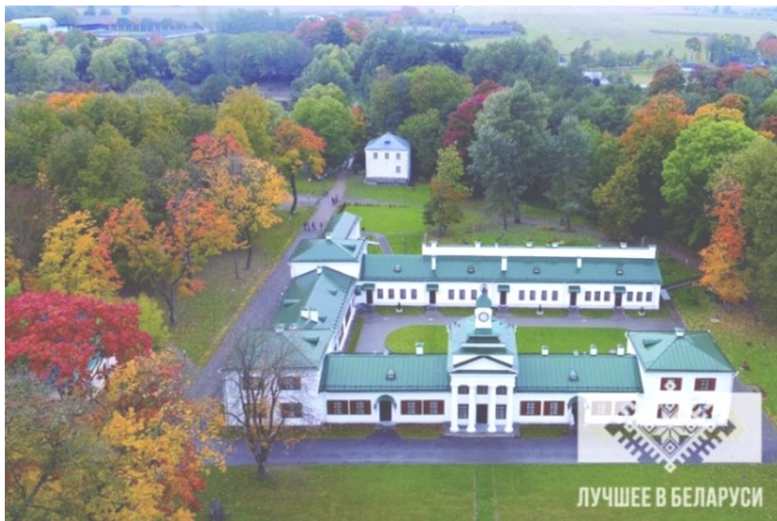
Рисунок 2. – Усадьба Огинского [8]

В самом сердце города Ивья, наша вторая остановка располагается Церковь Святых Петра и Павла. История этой постройки уходит корнями в готический храм XV века, который, к несчастью, был сильно поврежден во время конфликта между Речью Посполитой и Россией в 1654-1667 годах. Но несмотря на это, уже в 1787 году, здесь была освящена новая церковь, которую вплоть до середины XIX века использовали бернардинцы. Церковь Святых Петра и Павла великолепно расположена на самой высокой точке Ивья и всегда привлекает внимание путешественников. Во дворе здания установлена скульптура Христа с расправленными руками, невероятно напоминающая скульптуру в Рио-де-Жанейро, Бразилия. Особой изюминкой храма является его святыня – одна из 60 икон Казанской Божией Матери, которая в 2004 году побывала в космосе и более ста раз облетела Землю. Эту икону подарил костелу Виктор Шутов, уроженец Ивья и бывший сотрудник космического агентства России [9].