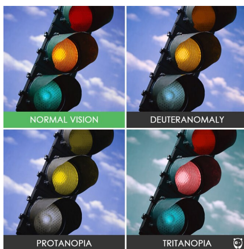
Рисунок 1. – Как дальтоники видят цветовые сигналы светофоров

Эта статья поднимает вопрос улучшения комфорта жизни людям с дефектами зрения. К этому списку относится часть населения с плохим зрением, а также с дефектами цветовосприятия. Стоит добавить, что люди с особенностями зрения не являются инвалидами. Инвалидность дают только в тех случаях, когда полностью или частично утрачена работоспособность зрительного аппарата, а дальтонизм или же такие распространённые дефекты, как дальнозоркость, близорукость и астигматизм, к этому не относятся. В случае дальтонизма человек может иметь хорошее зрение, имея при этом проблемы с отличием цветов. При этом для дальтоников и людей с плохим зрением имеются свои ограничения. Самым явным ограничением считается вождение машины, /3/. Дальтоникам банально сложно понять какой сейчас сигнал светофора, самыми частыми случаями является невозможность различить красные и зелёные оттенки (рисунок 1), /5/.