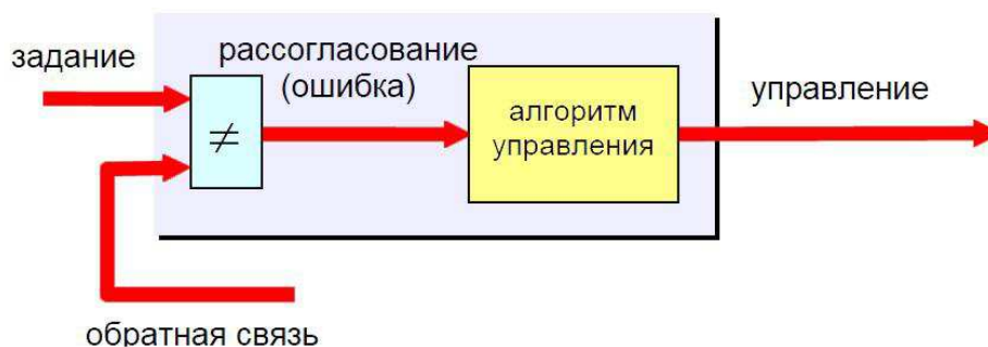
Рисунок 2. Принцип регулирования системой управления

Сравнивая их между собой, регулятор вырабатывает параметр рассогласования (ошибки управления), показывающий, насколько отличается фактическое состояние объекта от заданного (рисунок 2).