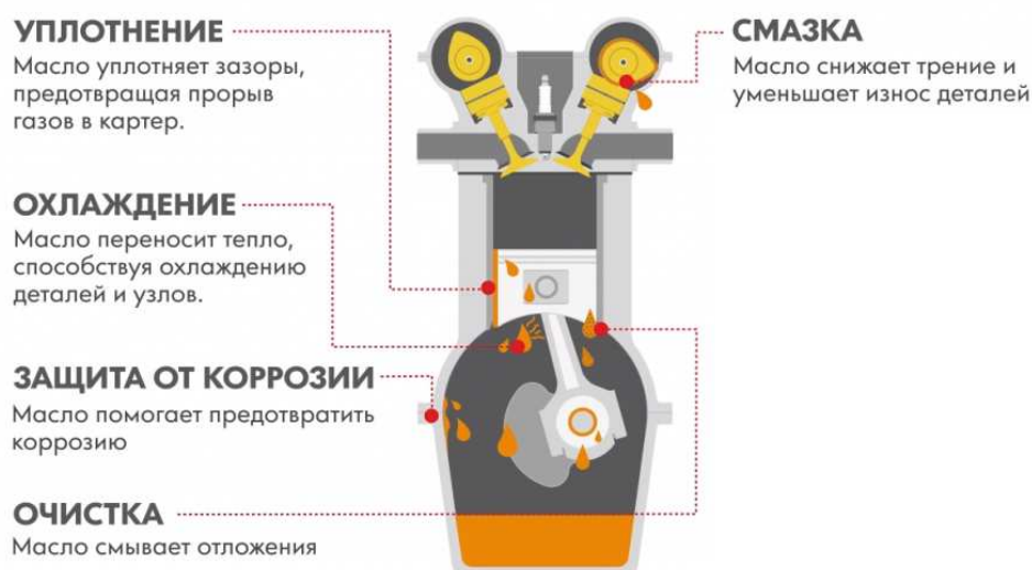
Рисунок 1. – Основные свойства, предъявляемые к маслам

Все вышеперечисленные свойства, предъявляемые к моторным маслам, невозможно было бы регулировать без качественно подобранной базовой основы и специальных добавок – присадок, их структуры, и наличия в них определенных функциональных групп и их расположения в молекулах (рисунок 2). Присадки – это синтетические химические соединения, вводимые в базовое масло для улучшения свойств в периоды эксплуатации и хранения. Основные типы и назначения присадок представлены в таблице 1.