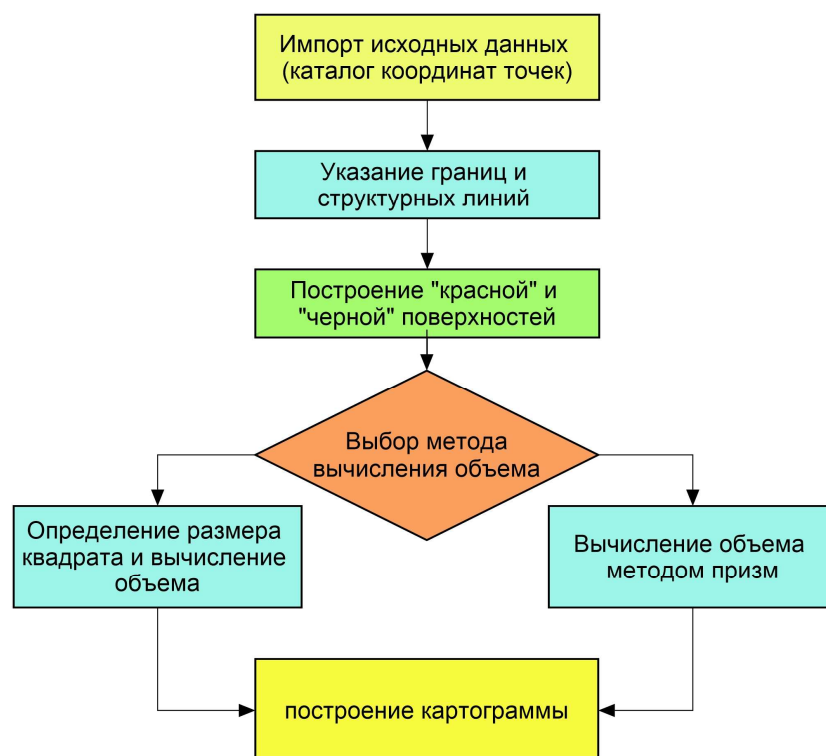
Рисунок 1. – Технологический процесс вычисления объема

Рассмотрим ПО GeoniCS для вычисления объема котлована по двум наборам точек, черновой поверхности и готового котлована. GeoniCS – это универсальная среда для выполнения работ в области геодезии, топографии, проектированию и реконструкции генеральных планов и линейно протяженных объектов (автомобильные и железные дороги, инженерные сети). Основной особенностью продукта является динамическая проектная модель, которая позволяет оперативно и без ошибок вносить изменения в проект на любой стадии проектирования и в любом представлении модели. Продукт отличается универсальностью, что позволяет организовать работу всех групп проектировщиков в единой интерфейсной среде. Технологический процесс вычисления объема земляных работ в GeoniCS приведен на рисунке 1.