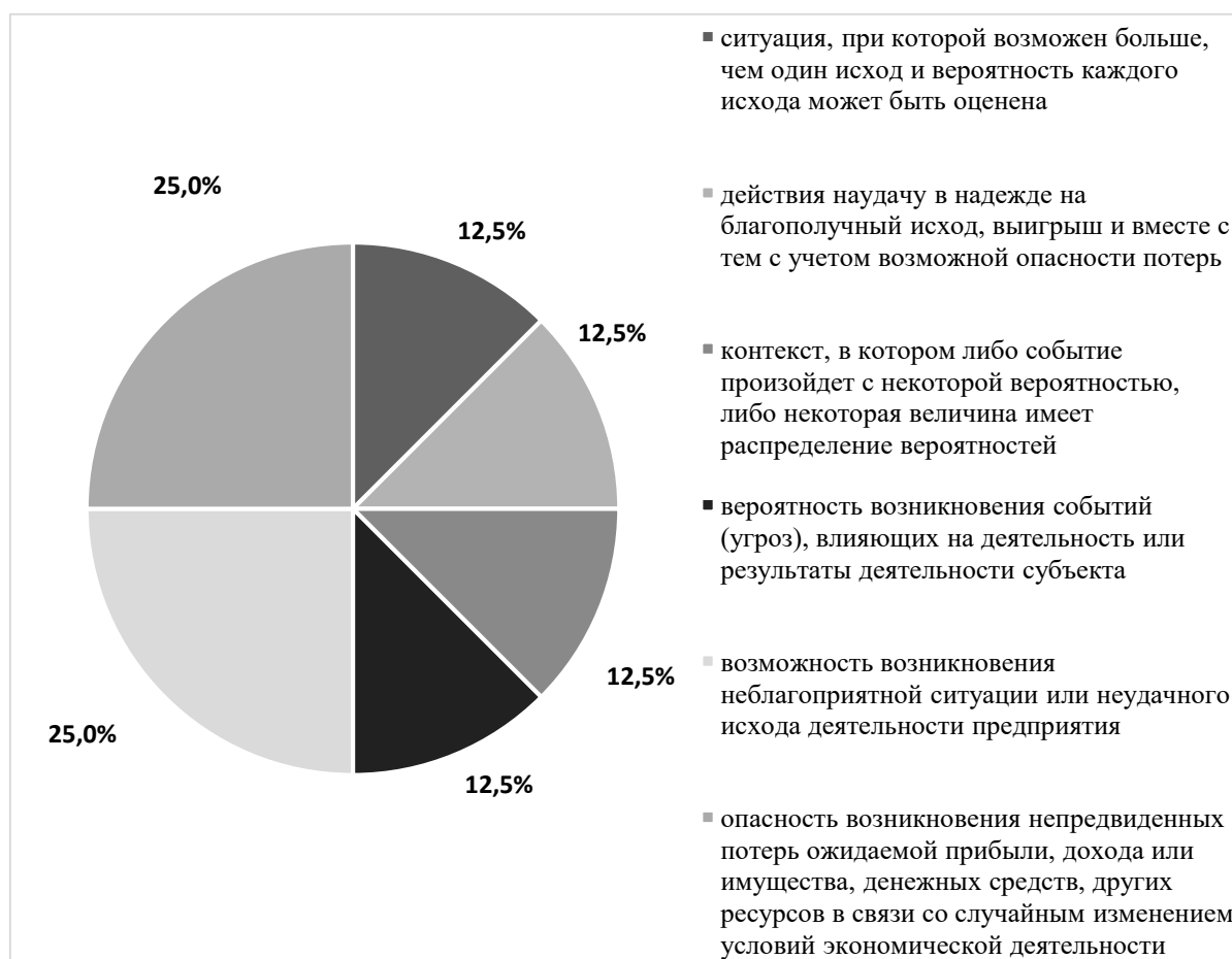
Рисунок 1. – Анализ сущности понятия «риск»

Изучив специальную литературу, нами было установлено, что многие авторы одновременно определяют термины «риск» и «неопределенность». Результаты проведенного исследования обосновывают вывод о том, что эти понятия формируют одну единую систему, в которой «неопределенность» выступает средой появления «риска», поэтому возрастание «неопределенности» может повлечь за собой еще больший риск. Результаты анализа сущности категории «риск» представим на рисунке 1.