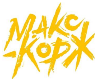
Рисунок 1. – Логотип Макса Коржа

Основной логотип выполнен в жёлтом цвете шрифтом Road Rage, именно в таком варианте его можно увидеть чаще всего. Также в выпускаемой продукции присутствует шрифт Intro, который используется для обложек клипов и афиш. Основными цветами, используемыми в продукции, являются жёлтый, как акцентный, чёрный и белый, как дополняющие.