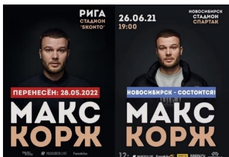
Рисунок 4. – Пример использования шрифта Intro на афише