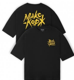
Рисунок 2. – Пример использования логотипа на одежде