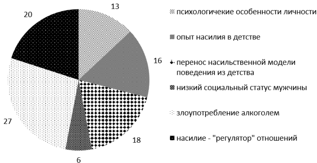
Рисунок 2. – Основные причины домашнего насилия, в %

На основании полученных данных, можно говорить о том, что основные причины домашнего насилия в семье состоят: психологические особенности личности – 13%, опыт насилия, пережитый в детстве – 16%, склонность к насилию, перенесенная взрослыми из семьи своих родителей – 18%, низкий социальный статус мужчины – 10%, злоупотребление алкоголем – 23 %, супружеское насилие – «регулятор» внутрисемейных отношений – 20% (Рис. 2).