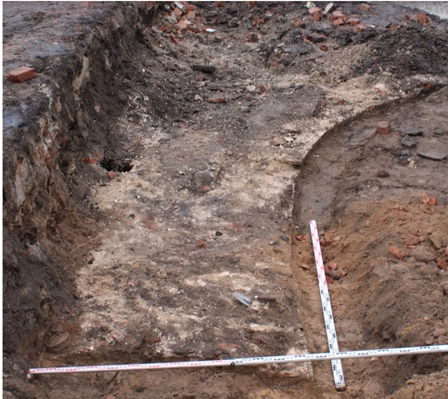
Малюнак 2. – Агульны выгляд працэсу раскопак апсіды храма