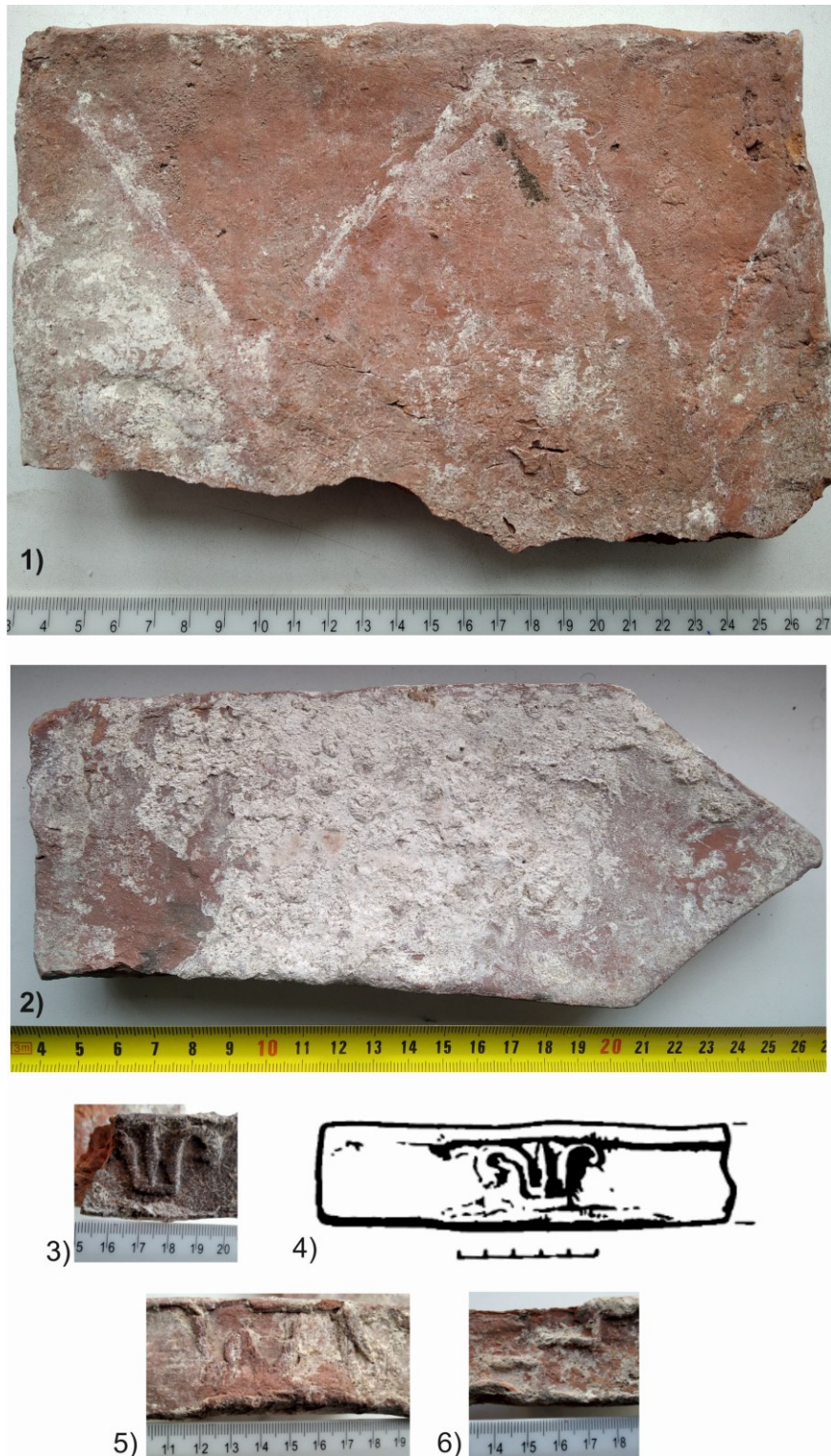
Малюнак 4. – 1) Плінфа з адбіткам “носікаў” лекальных цаглін; 2) Лекальная плінфа; 3), 5) Знакі трызубцаў на тарцах плінфы; 4) Знак трызубца з даследаванняў храма М.К. Каргера; 6) Знак з сальярнай сімволікай