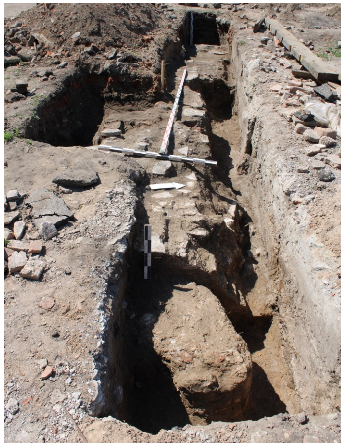
Малюнак 3. – Даследаванні ў траншэі 1. На пярэднім плане фрагмент падрыхтоўкі пад падлогу, заходняя сцяна храма і прымыкаючая да яе сцяна прытвора