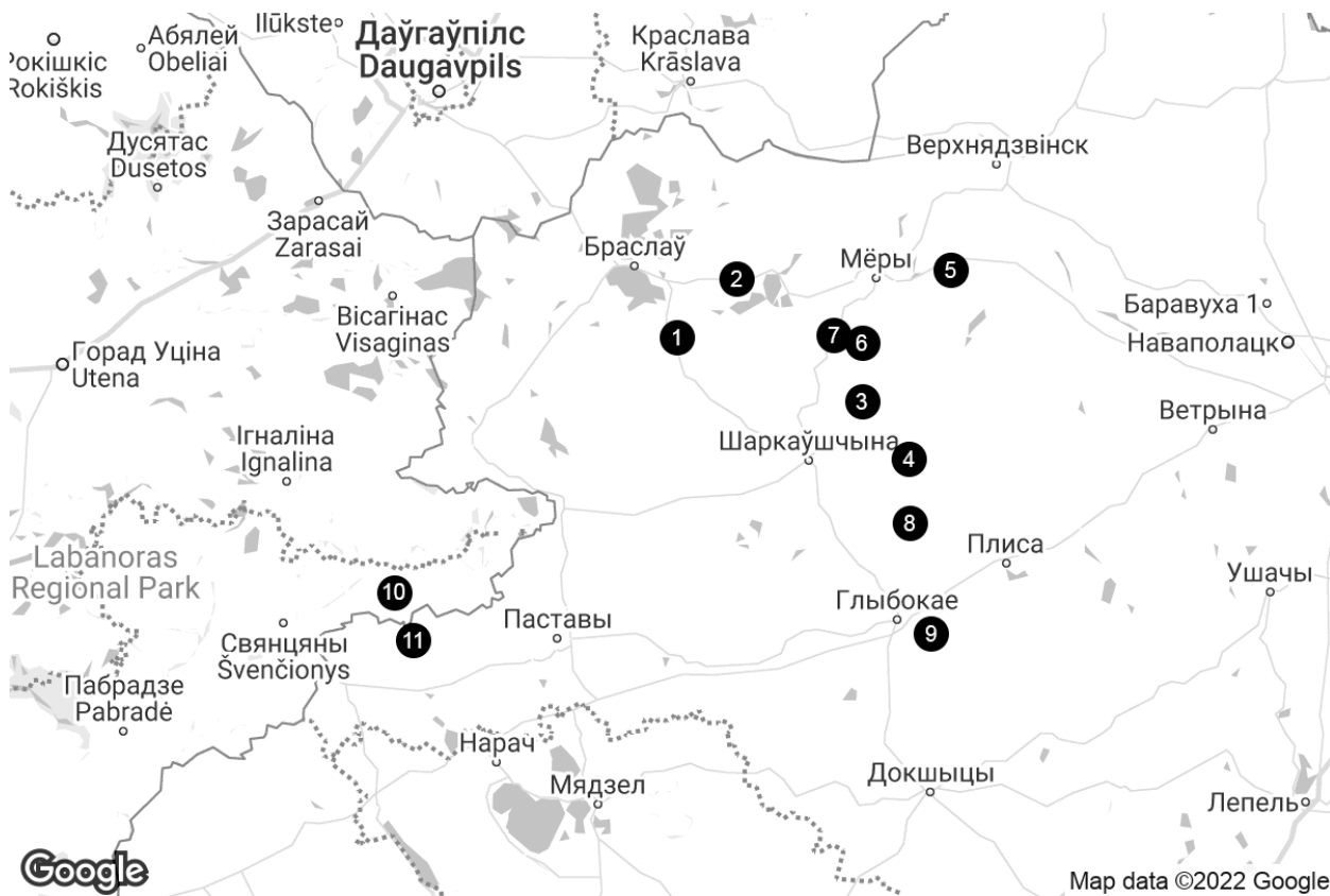
Мапа 1. — Аўдыё- і відэафіксацыі выканання крутук на тэрыторыі заходняга Падзвіння

музычна-стылістычнага, харэаграфічнага, жанравага, функцыянальнага аспектаў песенна-танцавальнай традыцыі старавераў уяўляюць нешматлікія аўдыё- і відэафіксацыі крутук (Мапа 1.)