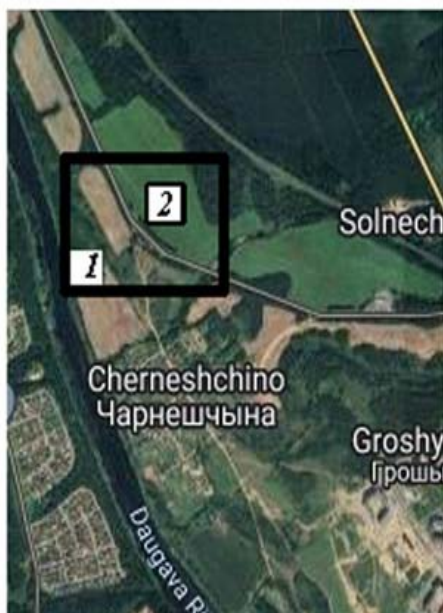
Малюнак 1. – Лакалізацыя мікрарэгіёна археалагічных прац у 2017 і 2020 гг.

У 2017 годзе групай археолагаў у складзе аўтара артыкула, Макс.М. Чарняўскага і П.М. Кенька было здзейснена абследаванне каля в. Чарнешчына і вынікі ўказаных прац былі часткова апублікаваны [7]. Таму сцісла спынемся на асноўных выніках прац 2017г.