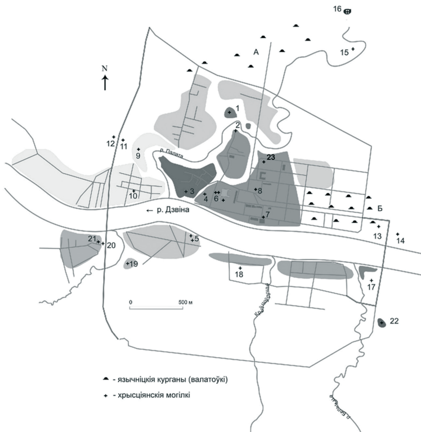
Илл. 1. План історычных могілак Палотска (па Д. В. Дуку) [8, илл. 58]. А, Б – курганьне некрополі; 2 – могілак на Ніжнем замку; 3 – пагребення в Софійскім саборы і на кладбішчы пры нем; 4 – некропаль пры царквы Раждства Хрыстова; 5 – могілак на Астрове; 6 – пагребення вольне іезуітскага каллегіума; 7 – пагребення вольне Богаўявленскага мана-стыря; 9–10 – кладбішчы на Заполотскім пасадзе