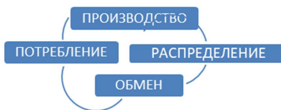
Рисунок 1. – Процесс общественного воспроизводства

Конечной целью производства, распределения и обмена является потребление благ. Политической экономией потребление рассматривается как звено процесса общественного воспроизводства. Потребление может выступать как: часть производственного процесса и элемент воспроизводства рабочей силы (конечное потребление благ людьми) [1, с. 35].